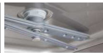
Brazo lavado y aclarado superior modelo LVP3250 Upper washing and rising arm model LVP3250