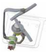
Bomba de lavado DuFlo Washing pump DuFlo