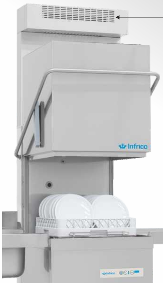
Con accesorios opcionales, pag. 578-579