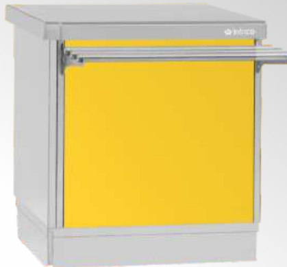
RAL 1018 Amarillo Yellow