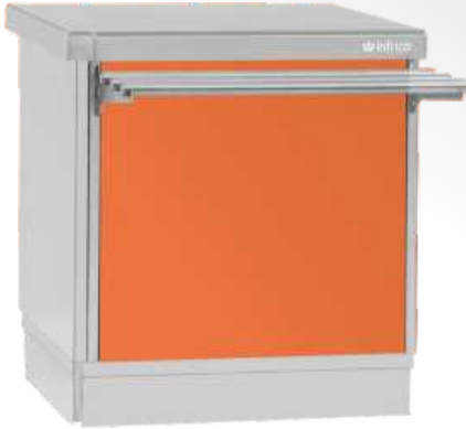
RAL 2003 Naranja Orange