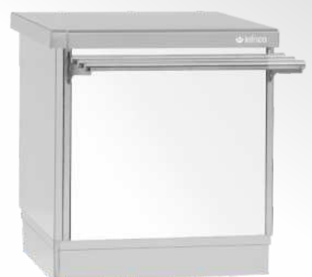
RAL 9016 Blanco White