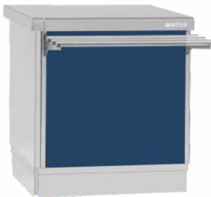
RAL 5017 Azul oscuro Dark blue