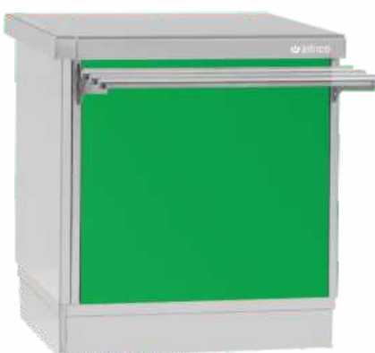
RAL 6002 Verde oscuro Dark green