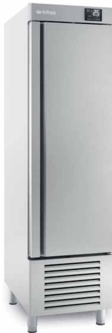
AN 401 BT