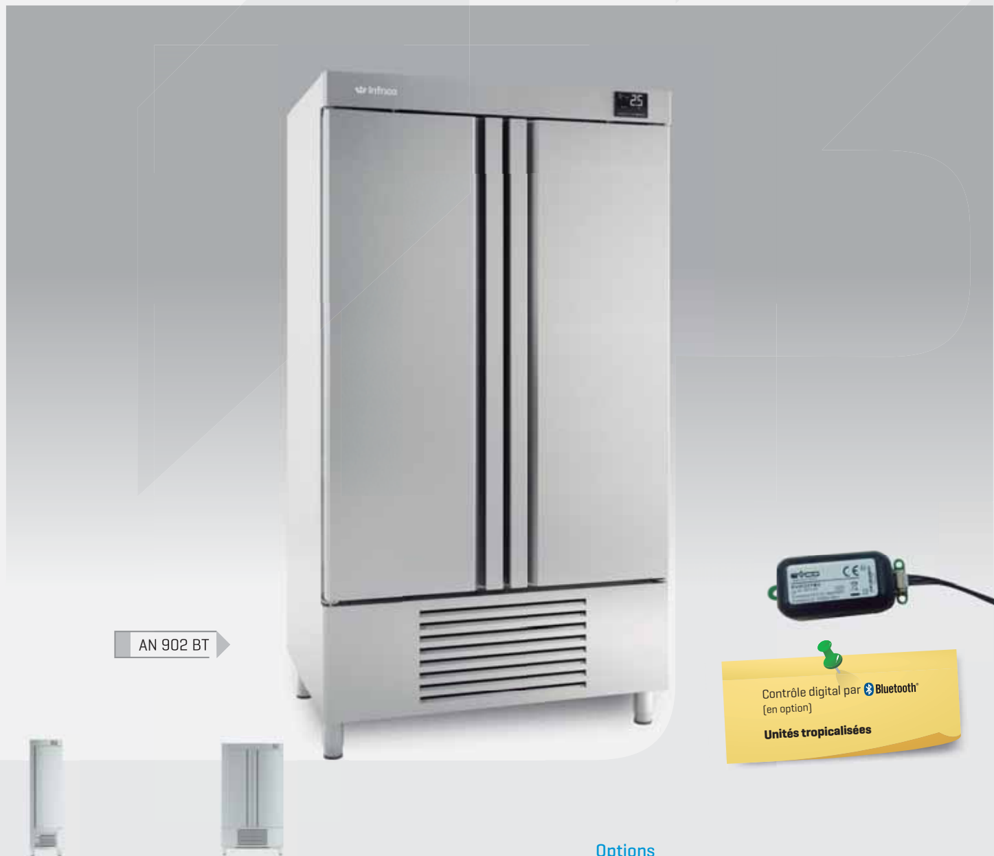
AN 902 BT