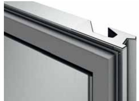
Porte avec double poignée et joint plat facilement démontable "cleanless".