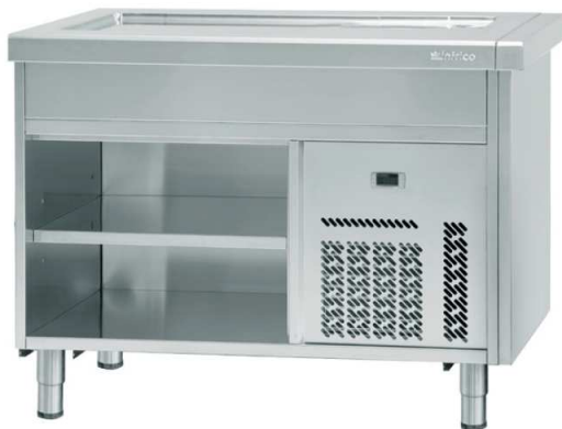
Con reserva neutra