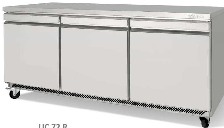
UC 72 R