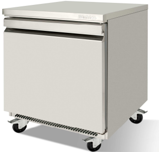
UC 27 R