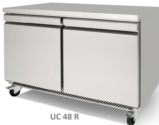
UC 48 R