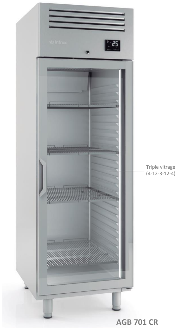
AGB 701 CR