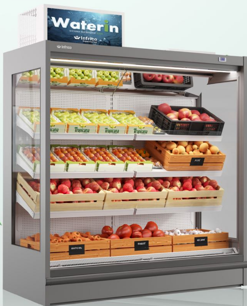
MURALE MPBWH1 WATERIN SYSTÈME