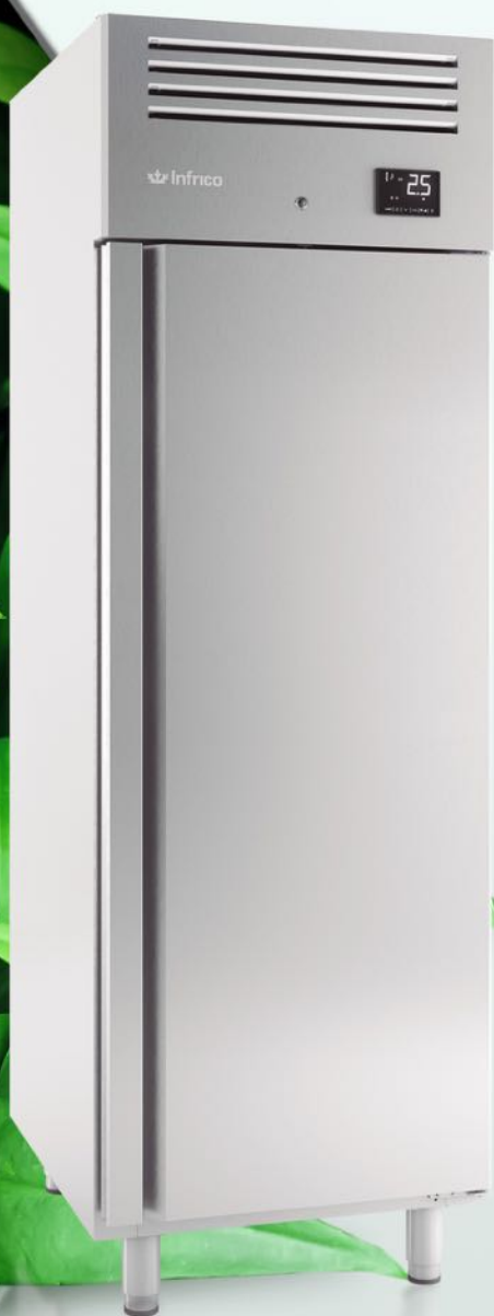
CABINET AGB701A TECHNOLOGIE INVERTER

Grupo Infrico continue à intensifier ses efforts en matière de durabilité en développant des produits plus efficaces et respectueux avec l'environnement.